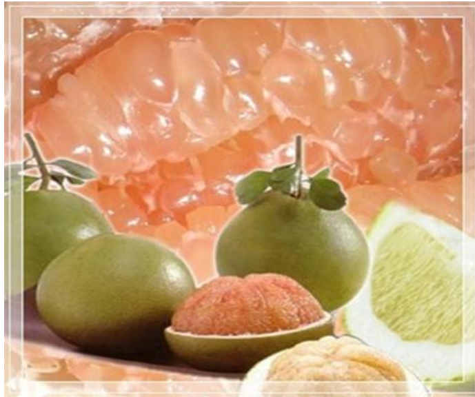
ภาพประกอบที่ 2 ผลผลิตส้มโอหอมควนลัง

ส้มโอหอมควนลัง มีลักษณะแตกต่างจากส้มโอพันธุ์อื่นอย่างชัดเจน และมีลักษณะประจำพันธุ์ที่เด่นชัด คือ เนื้อผลหรือกึ่งเป็นสีชมพูเข้มจนถึงสีแดง ไม่มีเมล็ด และมีกลิ่นหอมเฉพาะตัว