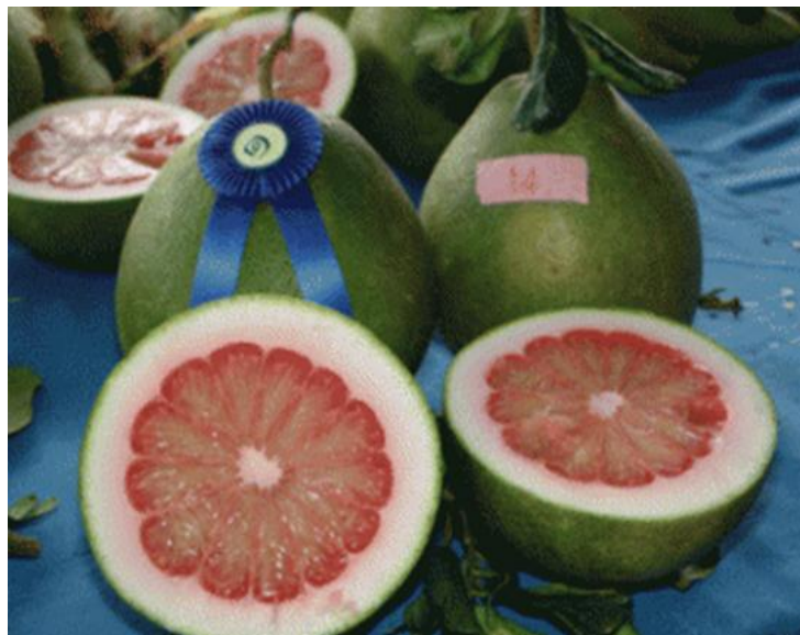
ภาพประกอบที่ 1 ส้มโอหอมควนลัง เมื่อผ่าซีกนำรับประทาน (ขณะการประกวด)

ส้มโอหอมควนลัง เป็นส้มโอพันธุ์ดี มีถิ่นกำเนิดและปลูกกันมากในเขตตำบลควนลังมาช้านาน แต่ในระยะหลังจนถึงปัจจุบัน การปลูกส้มโอหอมควนลังลดน้อยลง ในขณะที่คุณค่าทางเศรษฐกิจและความต้องการผลผลิตของการตลาดเพิ่มสูงขึ้น เกษตรกรและประชาชนที่สนใจ ต้องการและเรียกร้องให้มีการฟื้นฟูและพัฒนาการผลิตส้มโอหอมควนลัง เพื่อเป็นการพัฒนาอาชีพและยกระดับรายได้เกษตรกรและประชาชนของเทศบาลเมืองควนลังให้ดีขึ้น